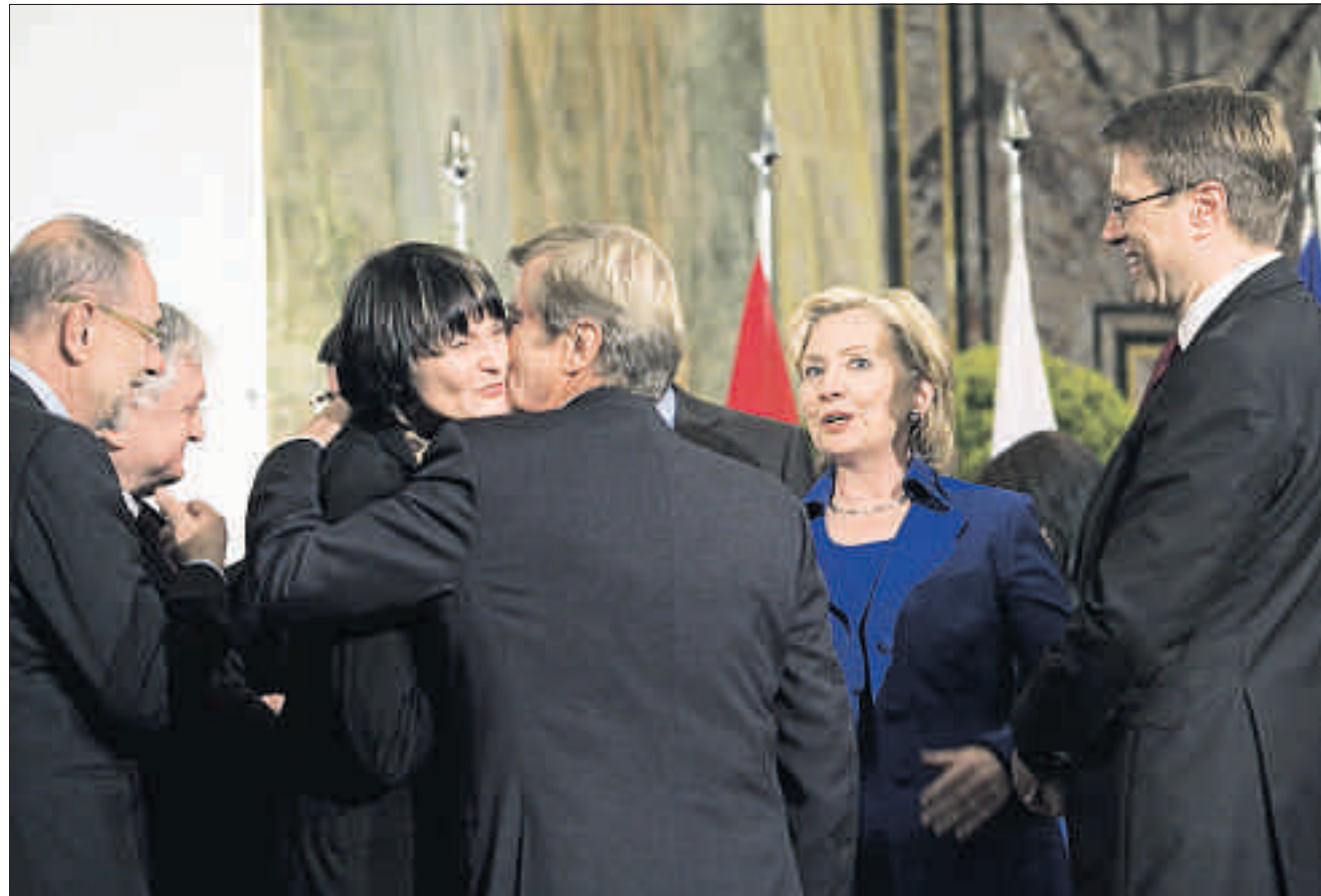
Damals herrschte Zuversicht: Micheline Calmy-Rey und Hillary Clinton bei der Unterzeichnung der Protokolle von Zürich. (10.10.2009)

Während Sarkissjan nun von «Suspendierung» spricht und damit die Hoffnung auf eine Weiterführung der An-